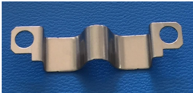
工业用流量计弹片